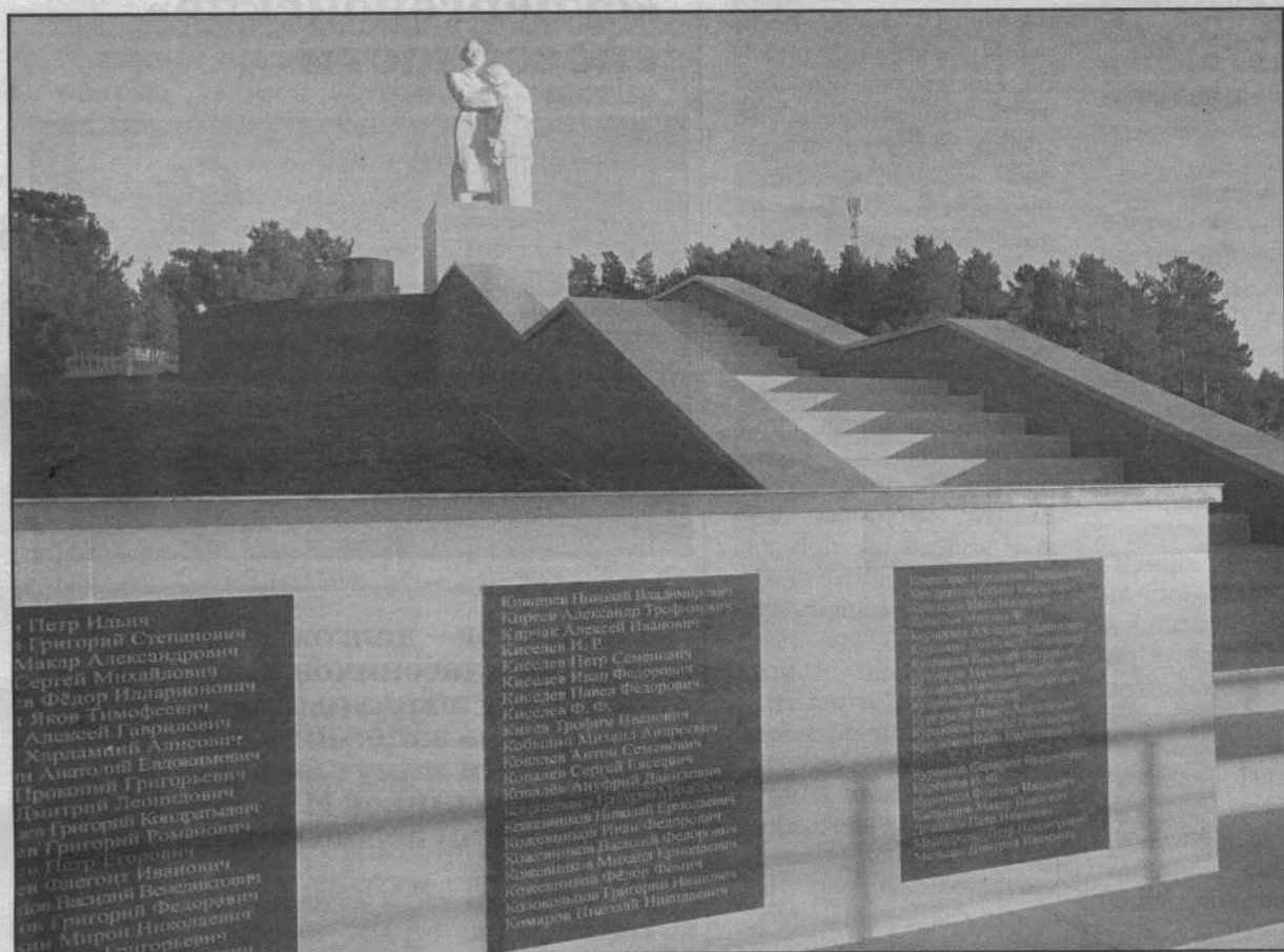
Мемориал односельчанам, погибшим в годы Великой Отечественной войны, в Ваганове.

В Промышленновском округе завершается реконструкция монументов и памятников